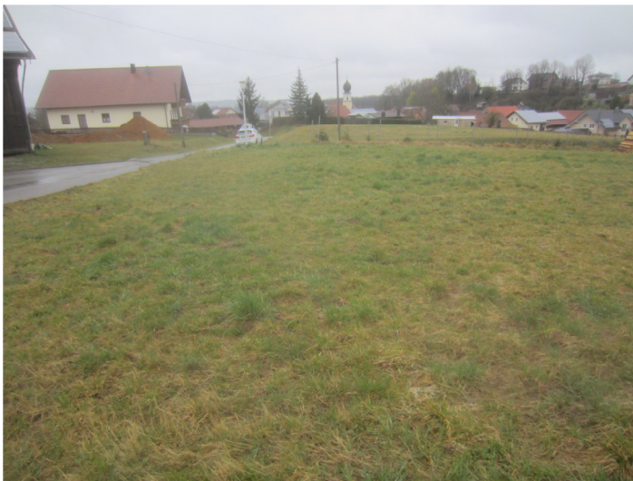
Blick von der südl. Grenze der Fl. Nr. 3000 nach Norden auf die geplante westliche Parzelle