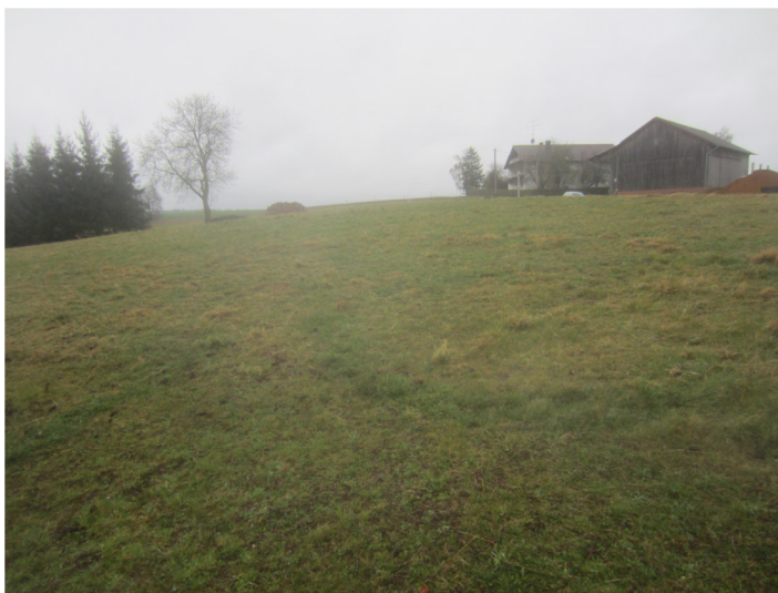
Blick von Fläche 1/4 vom Standort Gartenhaus nach Süden. Links zu erkennen die Fichtenreihe und der Nußbaum