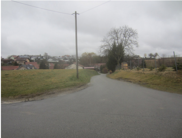
Blick von Westen nach Osten auf die Ortsverbindungsstraße. Linds Fl. Nr. 1/4, rechts Fl. Nr. 300