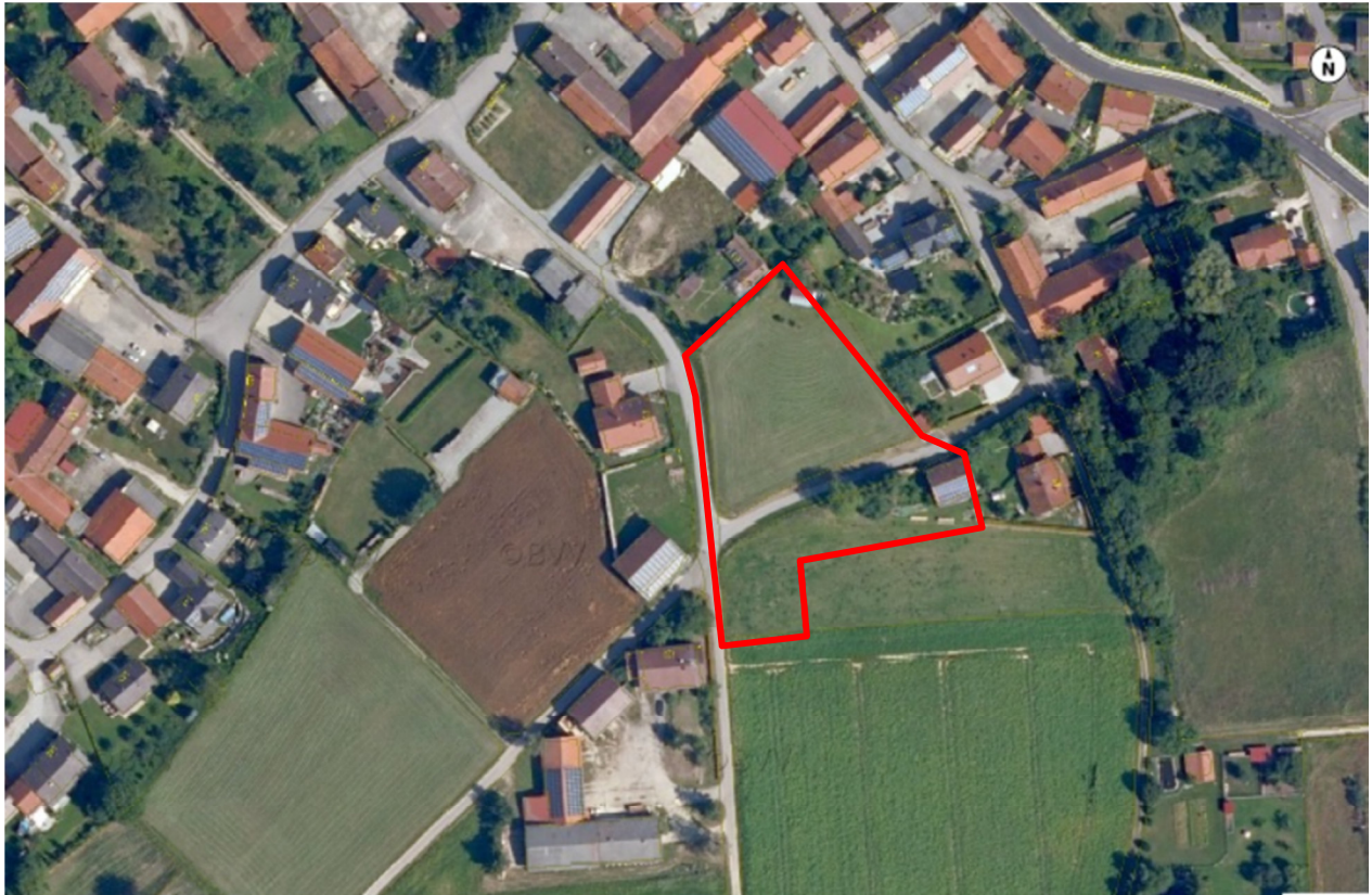
Luftbildausschnitt aus dem BayernAtlas vom 23.03.2022 – ohne Maßstab