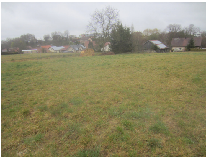
Blick von der südl. Grenze der Fl. Nr. 3000 nach Nord-Osten auf die geplante östliche Par- zelle und die vorh. Bebauung mit Gehölzen