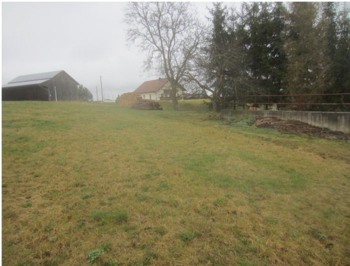
Blick von Fl. Nr. 300 südl. der vorh. Scheune nach Nord- Westen auf den Nußbaum und Fichten