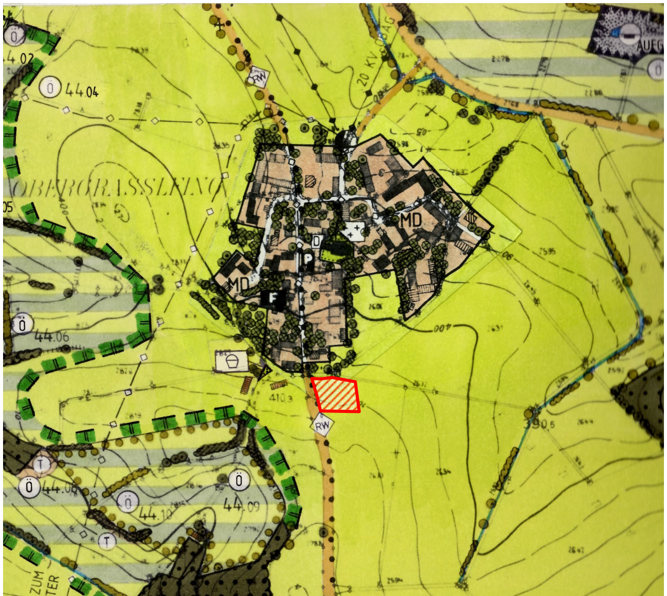
Ausschnitt aus dem Flächennutzungs- mit Landschaftsplan

Es liegen keine kartierten Biotopflächen innerhalb des Geltungsbereiches oder in seiner näheren Umgebung. Die aktuelle Nutzung umfasst landwirtschaftliche Flächen, Wohnbebauung sowie zwei landwirtschaftliche Nebengebäude.