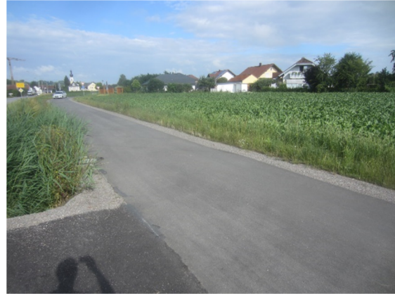
Blick nach Westen; im Norden vorh. Bebauung.

Bezüglich der gemeinschaftsrechtlich geschützten Arten (Pflanzen- und Tierarten des Anhangs IV FFH-Richtlinie und alle europäische Vogelarten nach Art. 1 der Vogelschutz-Richtlinie - feld- und wiesenbrütende Vogelarten) sind aufgrund der derzeitigen Nutzung (Ackerland/Hausgartenbereich) und der direkt angrenzenden Bebauung keine Verbots-tatbestände nach § 44 Abs. 1 i.V.m. Abs. 5 BNatSchG zu erwarten.