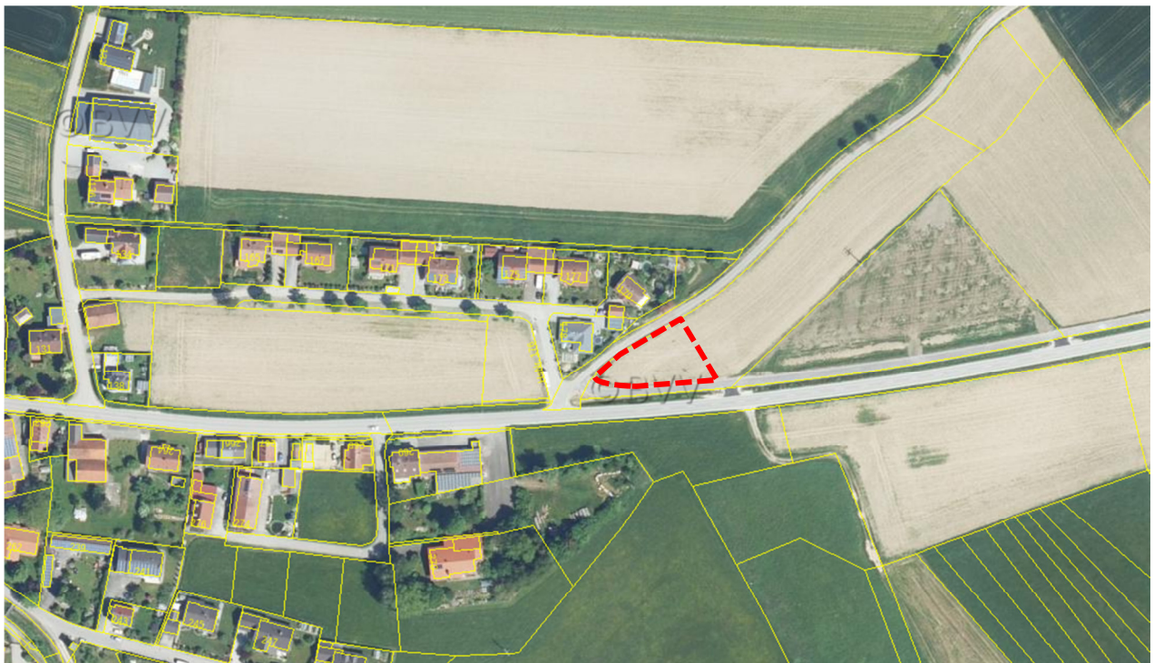
Abbildung 2: Luftbildausschnitt aus dem Bayern Atlas, vom 09.05.2022 mit Darstellung des Geltungsbereiches – ohne Maßstab