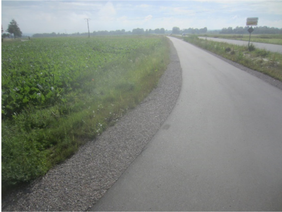
Blick nach Osten von vorh. Radweg