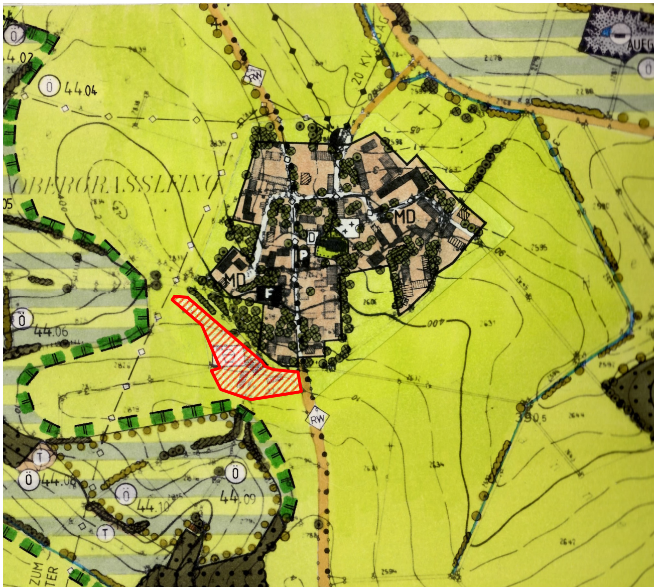
Ausschnitt aus dem Flächennutzungs- mit Landschaftsplan

Es liegen keine kartierten Biotopflächen innerhalb des Geltungsbereiches oder in seiner näheren Umgebung. Die aktuelle Nutzung umfasst landwirtschaftliche Flächen, Wohnbebauung sowie zwei landwirtschaftliche Nebengebäude.