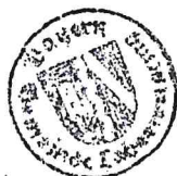
Johann Grau Erster Bürgermeister